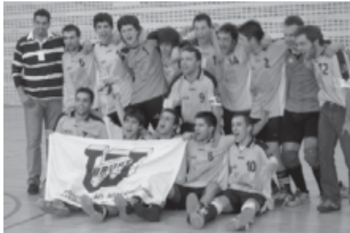
Equipa da UBI é a grande vencedora da Liga Universitária de Futsal