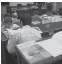
Encontro foi promovido pelo CIEBI